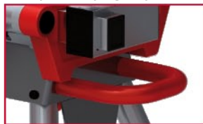
Uchwyt stalowy z gumą